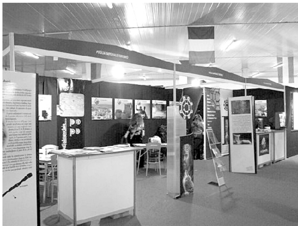
Canosa alla «Borsa internazionale del turismo archeologico» di Paestum